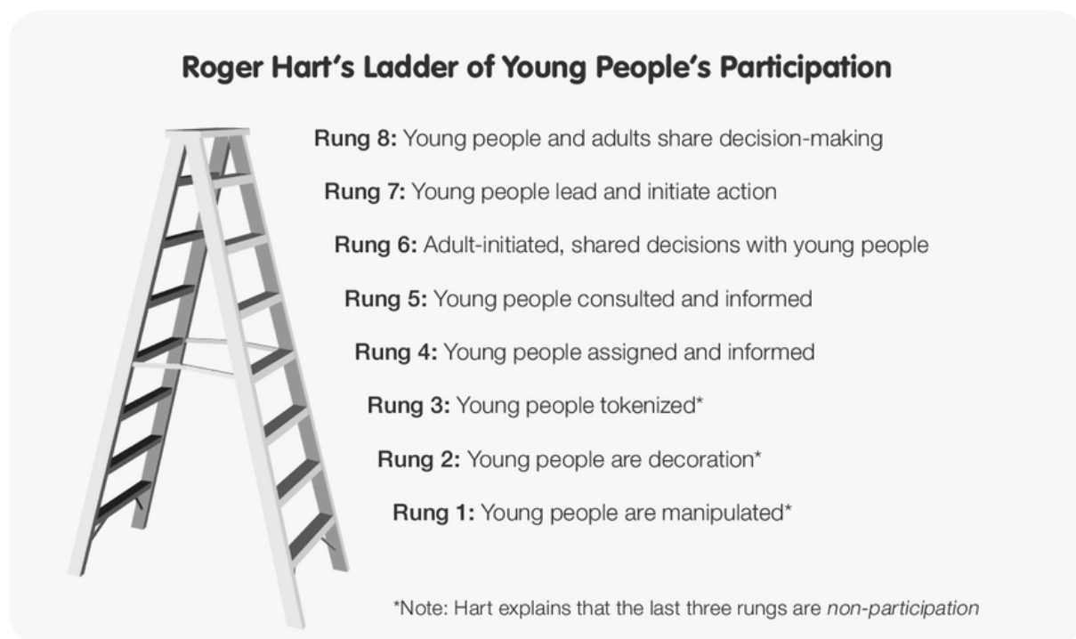
Slika 1.: Hartove ljestve glasa mladih

Važno je napomenuti da nije svaki oblik sudjelovanja mladih u odlučivanju jednako „pravo“, odnosno jednako participativan i otvoren za očitovanja, mišljenja i odabire mladih na koje se (navodno) odnosi. Neki oblici participacije mladih zapravo i nisu participacija u pravom smislu jer mlade ne tretiraju kao aktere, već potpuno pasivne adresate odluka čija je prisutnost u procesu odlučivanja izvedena isključivo na razini privida ili, u još gorem slučaju, služi tome da bi se mladima manipuliralo protivno njihovim željama i interesima. Jedna od teorijski dobro poduprtih shema koje ovo zorno prikazuju su i Hartove ljestve glasa (odn. participacije) mladih.