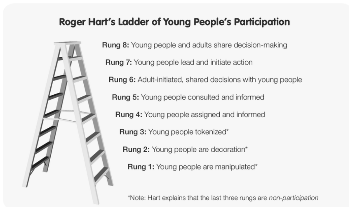
Slika 1.: Hartove ljestve glasa mladih

Važno je napomenuti da nije svaki oblik sudjelovanja mladih u odlučivanju jednako „pravo“, odnosno jednako participativan i otvoren za očitovanja, mišljenja i odabire mladih na koje se (navodno) odnosi. Neki oblici participacije mladih zapravo i nisu participacija u pravom smislu jer mlade ne tretiraju kao aktere, već potpuno pasivne adresate odluka čija je prisutnost u procesu odlučivanja izvedena isključivo na razini privida ili, u još gorem slučaju, služi tome da bi se mladima manipuliralo protivno njihovim željama i interesima. Jedna od teorijski dobro poduprtih shema koje ovo zorno prikazuju su i Hartove ljestve glasa (odn. participacije) mladih.